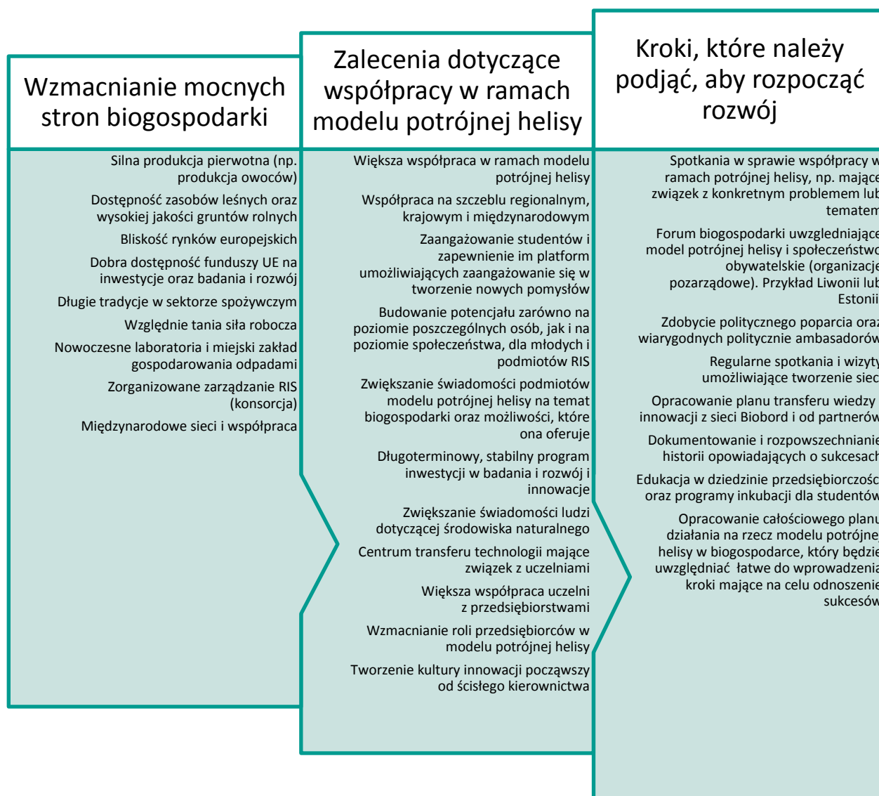
Rys. 4. Główne komunikaty dotyczące modelu potrójnej helisy (zaadaptowano i sporządzono podsumowanie na podstawie uwag recenzentów)