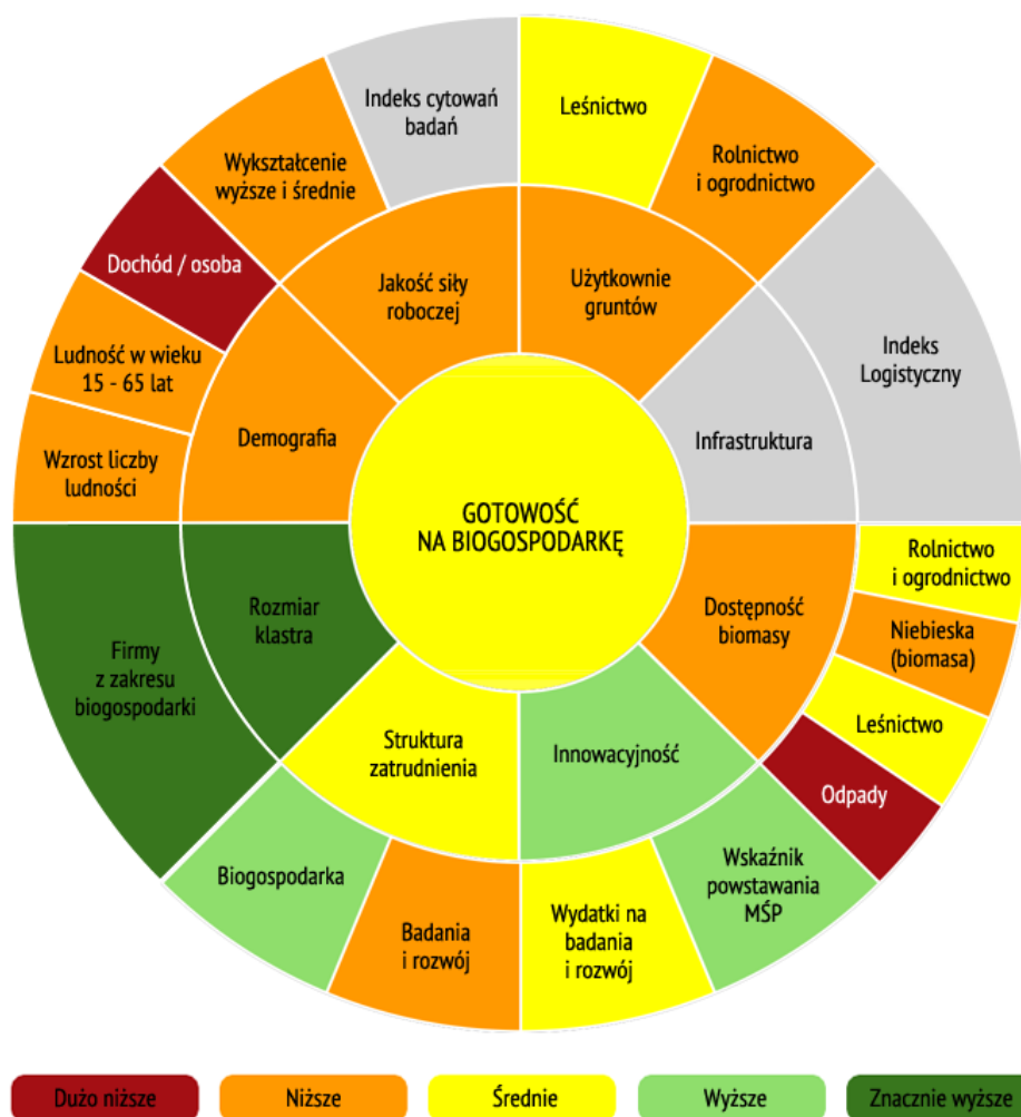
Rys. 1. Gotowość województwa świętokrzyskiego na biogospodarkę w 2016 r. w porównaniu z resztą Polski

Województwo świętokrzyskie posiada bogate zasoby naturalne. Jakość ziem rolnych jest wyższa od średniej krajowej, a region jest czołowym krajowym producentem owoców, w tym owoców pestkowych, oraz warzyw gruntowych. Ponadto, tereny zalesione (331 tysiące ha, tj. 28,3% obszaru) stanowią kręgosłup regionalnego przemysłu budowlanego. W regionie występuje silna tradycja wykorzystywania jagód leśnych, grzybów oraz dziczyzny w przemyśle spożywczym oraz paramedycznym (w tym w suplementach diety i kosmetykach), co podnosi potencjał rozwoju biogospodarki opartej na leśnictwie.