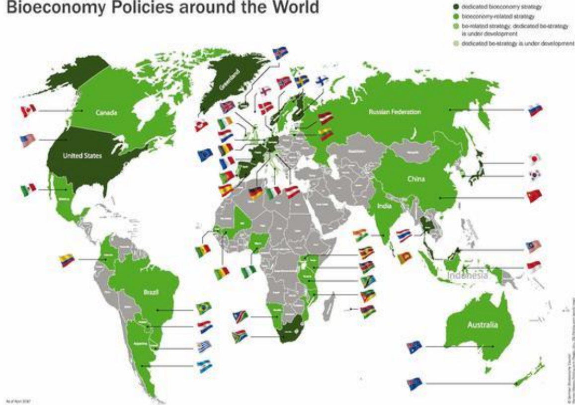
Bioeconomy Policies around the World